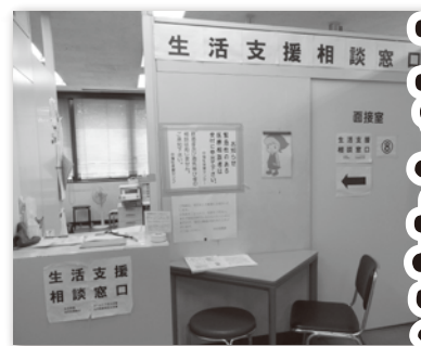
▲横浜市中区役所内にある相談窓口